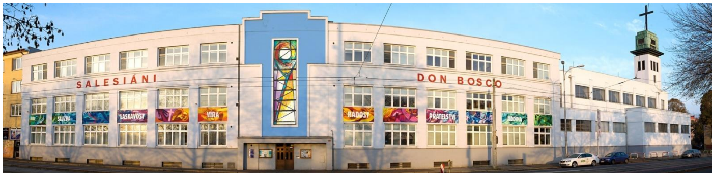
Současné foto s vizualizací vitráže v okně nad vchodem