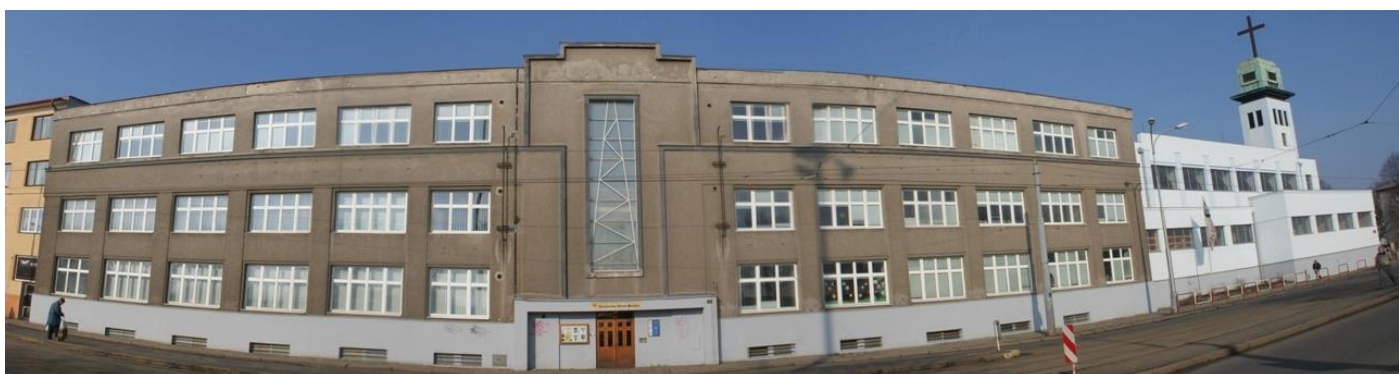
Fotografie z roku 2010

Okno o rozměru 8 x 2 m má strukturu těžní věže, což může vyjadřovat i to, že Kristus vychází z temného hrobu ven na světlo jako vítěz. To je důvod naší radostné víry. Radost a víra jsou také hodnoty na graffitech, které s oknem bezprostředně sousedí prostorově, barevně a myšlenkově. V okně nalezneme i další barvy, které se objevují na ostatních graffitech a také další, symbolicky zobrazené hodnoty: laskavost a přátelství, rodina a služba . Vše určitým způsobem souvisí se Vzkříšením.