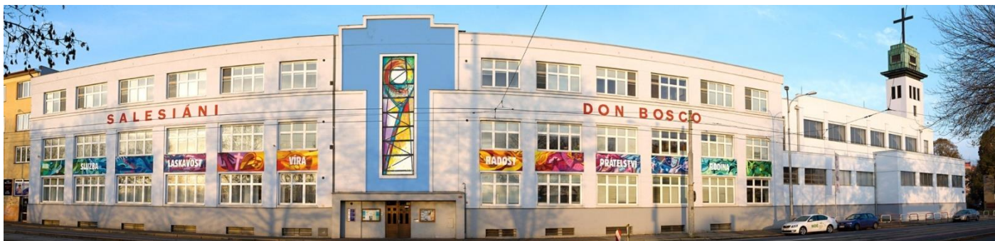
Současné foto s vizualizací vitráže v okně nad vchodem